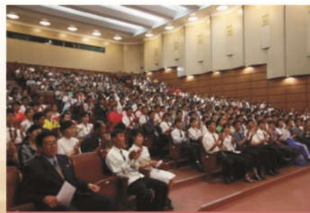
公司工会组织全体员工观看大型历史纪录片-《建党伟业》

回顾历史，再次温习今天幸福生活的来之不易。影片虽然只有短短的两个小时，但清晰地反应了一个新事物的产生所要历经的各种曲折的过程。所以说前进是曲折的，但发展是必然的。要怎样更快更稳更健康的发展，是现在我们所要思考的问题。科技的快速发展，带来的是物质文明和精神文明的突飞猛进；经济的全球化，带来不同文化的碰撞；但发展是柄双刃剑，各种关系的增多，导致矛盾也逐渐的增加。在相对稳定舒适的环境下，党员还能保持清醒的意识，还能时时清楚自己的职责，这恐怕是当下所面临的艰巨问题了。所以党员们还要怀有危机感和警惕性，还要发扬老一辈们的奋斗精神，始终扛起历史所赋予的重任，始终充当人民的领头人。而我们也要珍惜这来之不易的环境，切合实际，认真做好自己的工作，努力学习，贡献出自己的一份力量。作为一名党员，忠于党，报效国家，服务人民，是我们的毕生不变的追求，而做好本职工作，就是报国为民的最有效的途径。因此，我们要志存高远而脚踏实地，把献身国防与加强学习、做好本职工作紧密地结合起来，使两者互为表里、互为促进，更好地承担起时代和历史赋予我们的重任，为推动地方经济发展、社会进步做出应有的贡献！