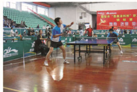
临安市“悉奥涂料杯”职工乒乓球锦标赛比赛现场

本次比赛采用中国乒乓球协会编译的国际乒联最新乒乓球竞赛规则，分为男子团体、女子团体、男子俱乐部团体甲级、男子俱乐部团体乙级四个项目，共有来自机关部门、镇（街道）、企事业单位的54支队伍、200余名运动员参加比赛。经过两天一夜118场紧张激烈、精彩纷呈的分组循环赛和淘汰附加赛，最终，浙江农林大学、广安物流、桑索服饰分别获得女子团体前三名，悉奥一队、锦南土石方一队、万晶涂料分别获得男子俱乐部团体甲级前三名，锦南土石方二队、悉奥二队、顾家工艺分别获得男子俱乐部团体乙级前