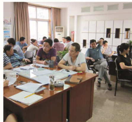
第五次读书学习会

管理没有捷径，想走捷径，一定会失败。组织系统智慧把我们原先阐述的企管会集体智慧又提升了一个新的高度，如何将目前较为松散的企管会集体智慧转变为较为缜密的组织系统架构所形成的集体智慧，这是摆在我们面前要立即付之行动的课题。尽管11年来，我们比较注重团队建设、整体配合、集体智慧方面的工作，今天面临的市场很残酷，明天会更残酷，如果八仙不多学一套本领，一定无法过海，一定会被无情的大海所湮灭。只有这样，引领悉奥打造工程涂料第一品牌才有希望，乃至走在国内工程涂料的市场前沿才有希望。