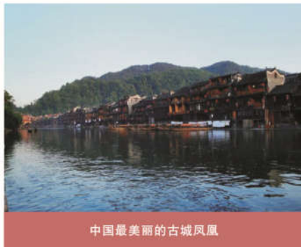
中国最美丽的古城凤凰

帘，两岸的吊角楼整整齐齐的排成了一行，木头做的支架歪歪斜斜的支撑着上头的小屋子，显得有些力不从心，但还是忠心耿耿的树立着。一家的主妇在窗口摆弄着些小花小草，几个老太太坐在河岸边的屋檐下边做着活计边聊天。一切都是那么安详、平静。没多久，船老大就吆喝我们上岸了，我总觉得这段沱江的路还远远不够。