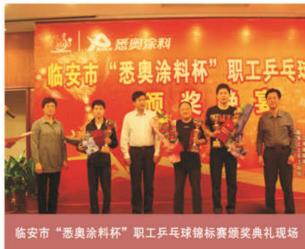
临安市“悉奥涂料杯”职工乒乓球锦标赛颁奖典礼现场