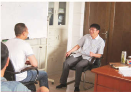
现场演示——洽谈业务

我们在聆听他人意见时，必须持以积极认真的态度。切忌在聆听他人意见时心不在焉。如果发现他人的观点与自己的见解存在较大差异时，也不必采取强烈的排斥心态，因为只有集思广益，才能形成更完善的策略，只有进行更多观点的交流与碰撞，才会使我们的工作得到不断地创新。