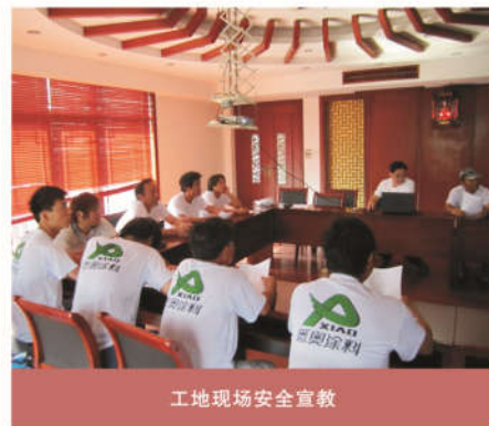
工地现场安全宣教

所以，作为工程管理人员，我们必须在工作中不但要重视学习业务知识，积极利用参加业务知识培训等机会聆听专家的指导，向专家请教学习，还应注重虚心向身边优秀的同志学习，学习他们丰富的工作经验、方法方式和敬业精神，增强责任意识和自律意识，同时还要积极学习新知识，熟悉新学科，努力做到融汇贯通，联系实际，提高自己的业务能力。在实际工作中，把理论知识、业务知识和其它新鲜知识结合起来，开阔视野，拓宽思路，丰富自己，努力适应新形势、新任务对本职工作的要求。