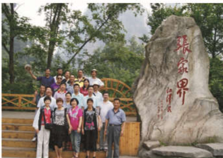
全体张家界凤凰出游人员合影

二小时的飞机很快我们到了湖南长沙，我们一行20人下了飞机就坐上了去伟人故里韶山旅游巴士，车辆沿着宽阔的公路疾驰，习习凉风带着新鲜的空气吹进车窗，空气中柔漫着一股进入大自然的气息，让人闻之不禁神清气爽。