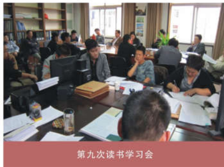
第九次读书学习会

协管经理作为公司市场部运作的排头兵，分析市场信息的真伪、处理事件的主观能动性，直接影响到市场工作整体运行。我们作为激烈市场竞争中的战斗员，在把握公司战略意图的同时，更多运用事件的发展，协同业务员做好每个工作的细节，想业务员所想，急业务员所急。在任何一个工程案例中，做到合同前深入一线跟踪指导，为以后公司领导层做决定，提供充分依据，避免被业务员报喜不报忧的局面所牵制；合同商洽过程中排除不利条件，争取到有利于公司、有利于业务员、有利于后期各项开展的三赢效果；施工中做到材料组织到位、工程协调到位、施工工序节点检查到位、资金支付节点跟踪到位、业务员业务费结算保障到位的立体服务网络。工作要让各部门围