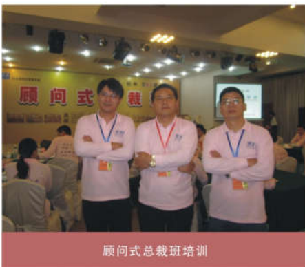
顾问式总裁班培训

而管理者则因为事情没有得到应有的处理而耿耿于怀，内心对这个人的抱怨越来越大。终于有一天会将自己的怨气发泄到这个人或一些不相干的人和事上，反而对公司的管理造成更大更坏的影响。