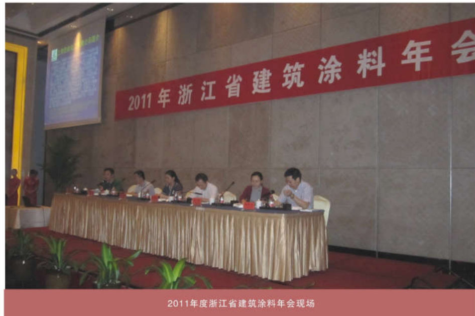
2011年度浙江省建筑涂料年会现场

优秀原材料供应商5家、优秀设备供应商1家的获奖企业名单，浙江悉奥涂料有限公司蝉联荣获2011年度浙江省建筑涂料优秀企业的同时，也被评选为2011年度浙江省关爱员工优秀企业荣誉称号。会议就W/W多彩涂料和反射隔热涂料等热点专题进行了大会交流，公司总工连城就浙江工程涂料市场做了大会交流，会议至18日下午所有参会代表应邀参观了浙江新力化工有限公司。