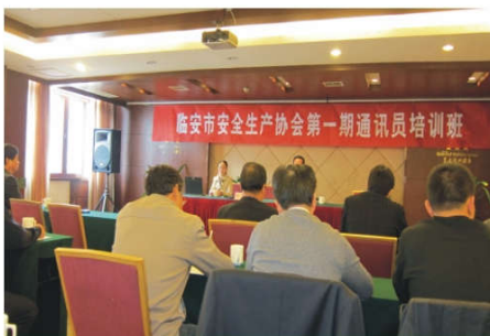
安全生产协会通讯员培训班

企业文化承载着人的全部潜能，而人的问题的解决的最佳方法是教育、培养，只有把人的一切积极因素调动起来了，才能把人的工作做好，那么其他问题也就迎刃而解了，因此企业文化是关键。当人们看到海洋上飘着红色瓶子，自然会想到可口可乐，当人们看到西部牛仔骑马在草原驰骋的时候会自然地想到