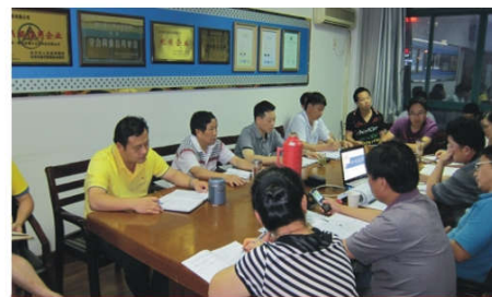
公司八级以上员工读书学习会

在组织实施过程中，要科学组织，加强监督管理，防止在实施过程中出现问题。勤了解，全面掌握工程整个实施执行过程，及时与有关各方协调沟通，有效沟通往往在事前，不是在事后。及时签约需签约的工程联系单和往来书面交流信函等有关文书；对工程所发生的有关文书，必须造册登记，统一管理，以